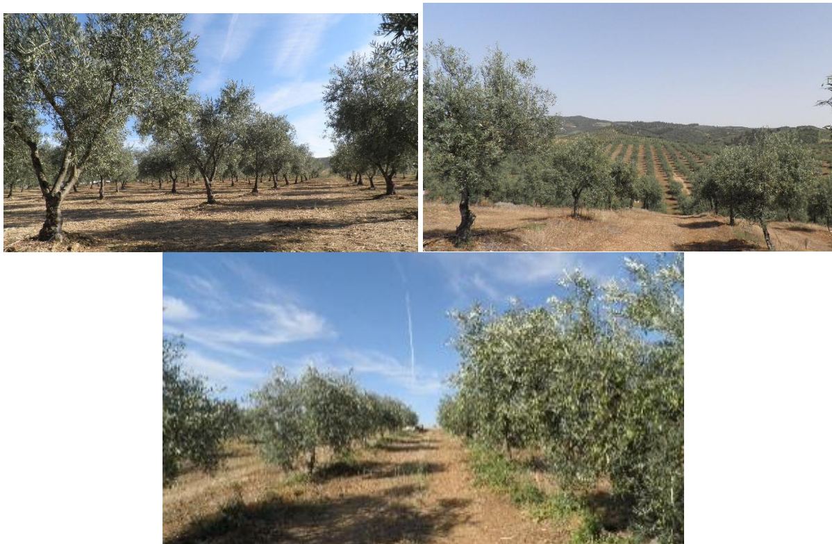
Figura 3. Em cima à esquerda: olival com cultivar Cobrançosa ; à direita: olival com cultivar Negrinha de Freixo ; em baixo ao centro: olival com cultivar Cobrançosa

No que concerne às estratégias de rega deficitária a adotar nos olivais passam por i) SDI - rega deficitária contínua, baseada na distribuição uniforme do défice hídrico sobre todo o ciclo da planta, para evitar a ocorrência de stresse hídrico severo em períodos mais sensíveis, ii) RDI - rega deficitária controlada com interrupção da rega nos períodos em que a oliveira é menos sensível ao défice hídrico (fase de endurecimento do caroço), regando sem restrição hídrica nos restantes períodos. O tratamento controlo, corresponde à aplicação de água que satisfaça as necessidades de rega da oliveira. A água aplicada pelo sistema de rega tem em linha de conta a eficiência do sistema de rega.