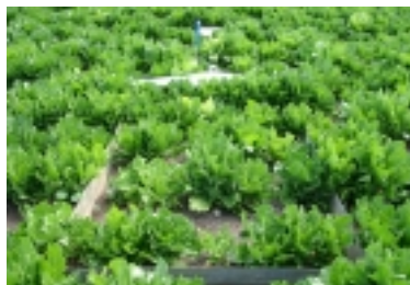
Figura 1—Ensaio de escoamento superficial