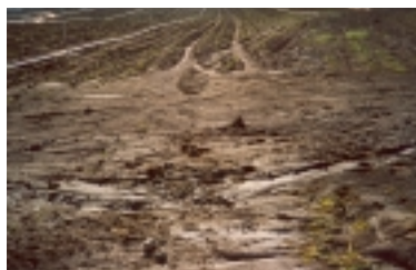
Figura 2—Erosão do solo no final da parcela