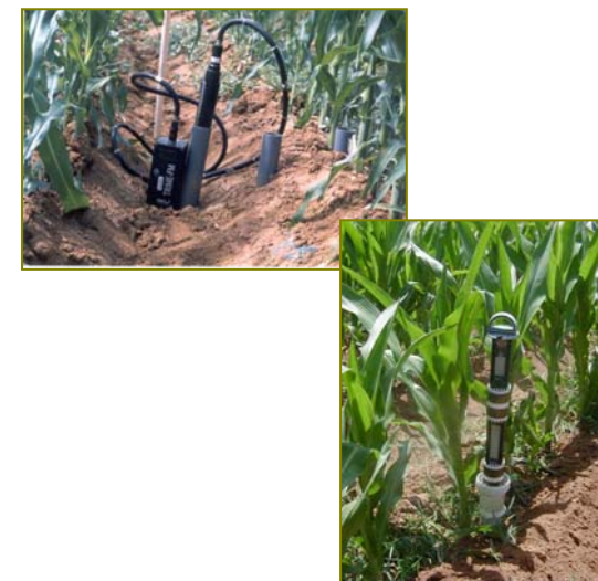
Figura 2 – Estações de Controlo – Teor de Água no Solo entre Regas (Sonda TDR e Sistema EnviroSCAN)