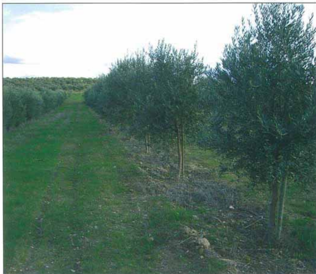
Aspecto do olival experimental da Herdade dos Lameirões, no Pólo Experimental do COTR, em Moura

As necessidades potenciais de água do olival (ETc) dependem do clima, do tipo de solo e da reserva de água do solo disponível a partir do momento em que a evapotranspiração cultural supera a precipitação (normalmente no fim do Inverno). Além destas características, o tipo de olival (compasso de plantação e desenvolvimento vegetativo) influi significativamente sobre as necessidades totais, assim como, sobre a produção média do olival. Aumentar a densidade de plantação com o objectivo de aumentar a capacidade produtiva da plantação, para um determinado volume de copa por árvore, aumenta a superfície de solo coberta (Kr) e, portanto, aumenta as ne-