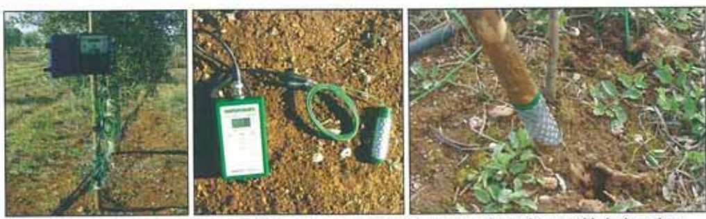
Figura 1: Logger para armazenamento da informação em contínuo (a), sensor watermark com unidade de registo portátil (b) e pormenor da instalação do sensor no solo (c)

Nos primeiros anos após a plantação, a estratégia consiste em disponibilizar água ao olival sem qualquer restrição, de forma a garantir a correcta instalação e o rápido desenvolvimento. Nesta fase, a metodologia para a condução da rega, essencialmente desenvolvida para olivais adultos, não tem um ajuste perfeito a situações em que a percentagem da superfície de solo coberta pela copa da cultura (Kr) e o volume de copa são muito reduzidos, o que acontece até cerca do segundo ou terceiro ano após instalação, dependendo das variedades utilizadas. Pelo que a condução da rega, e como tal a determinação das necessidades em água, deve ser acompanhada pela monitorização da água do solo.