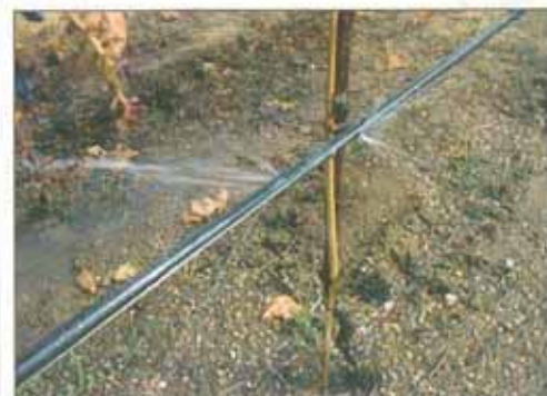
Figura 5 – Rotura num lateral.

Recomenda-se que a avaliação de um sistema de rega seja feita logo após a sua aquisição (para verificar se o projectado se confirma no terreno), antes do início de uma campanha de rega (de forma a detectar eventuais problemas), ou sempre que se suspeite de anomalias. ●