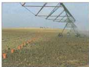
Figura 3 – Determinação da uniformidade na avaliação de um pivot.

cabo pelos agricultores mais exigentes. Noutros, embora por opção, ou por motivos económicos, não fosse justificável qualquer intervenção, pelo menos houve interesse por parte do agricultor em registar os conselhos e sugestões emitidas, com vista à melhoria da gestão da rega e a uma maior atenção relativamente ao comportamento do equipamento e aos cuidados de manutenção.