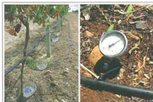
Figura 4 – Medição de caudais em gotejadores e da pressão num lateral de rega.

A avaliação de sistemas de rega localizada, nomeadamente gota-a-gota, iniciou-se posteriormente, sendo que a aceitação por parte dos agricultores beneficiados tem sido bastante positiva, já que consideram que o trabalho desenvolvido possibilitou um melhor conhecimento dos seus sistemas de rega, podendo, com esta informação, tirar maior partido da gestão efectuada. Em muitas situações estes agri-